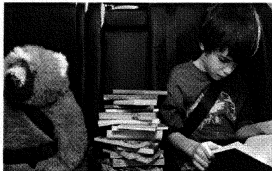
A legfontosabb a biztonság

Amennyiben bűncselekmény áldozatává vált, az észlelést követően azonnal értesítse a rendőrséget, és kérjen segítséget a 112-es segélyhívó számon!